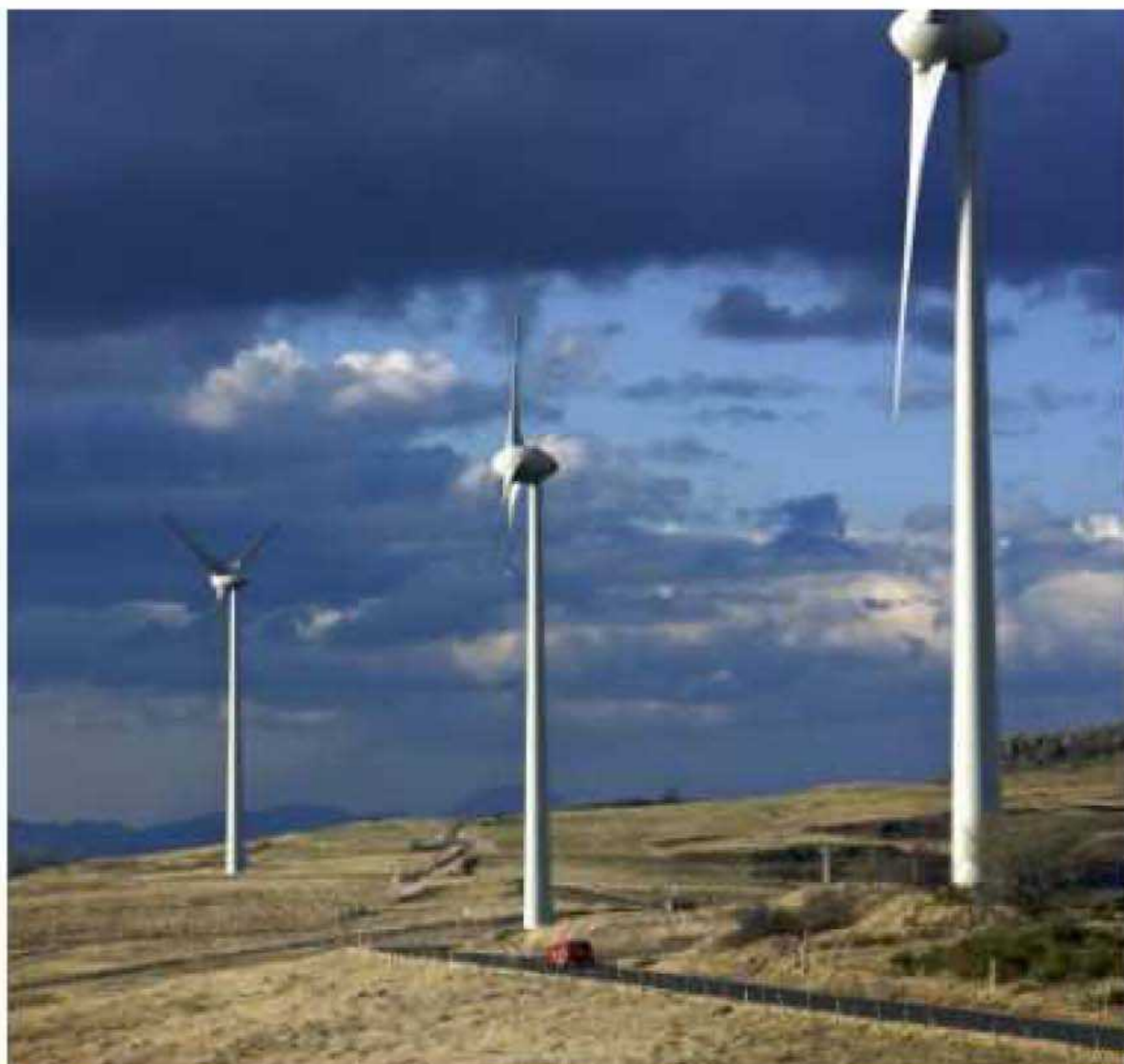
Le parc éolien du plateau d'Ardes, dans le Puy-de-Dôme.

Les mêmes causes produisant les mêmes effets, le tissu social se déchire dans tous les villages concernés. Et voilà qu'on parle maintenant d' impact possible sur la santé publique . On est dans la destruction durable.