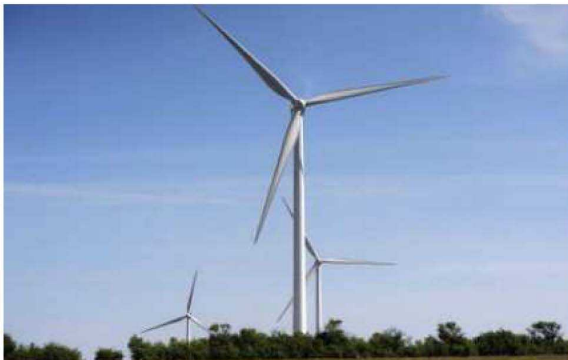
Le parc éolien "Porte de France", sur les hauteurs de Bousbach en Moselle, a été inauguré le 7 mai 2011.

En France, l'opposition à l'éolien industriel se développe indépendamment de toute influence politique et de tout dogmatisme sur le nucléaire. Sa seule raison d'être: un profond respect des territoires ruraux, des ressources naturelles, de la biodiversité, des paysages, du silence et un engagement à valoriser ces territoires pour les générations futures plutôt qu'à les hypothéquer pour faire de l'argent tout de suite et maintenant.